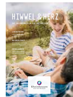
Urlaubsmagazin „Hiwwel Herz“

Aktuelle Informationen, Prospekte und Karten zum Bestellen oder Download finden Sie auf www.rheinhessen.de