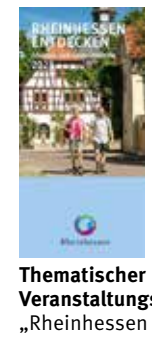
Thematischer Veranstaltungskalender „Rheinhessen entdecken“