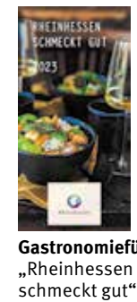
Gastronomieführer „Rheinhessen schmeckt gut“