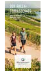
Wanderkarte „Der Rheinterrassenweg: Wandern zwischen Worms und Mainz“