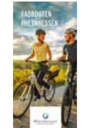
Radkarte „Rheinhessen – Radeln zwischen Rhein und Reben“