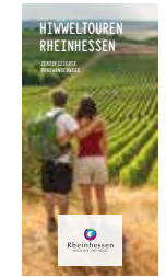
Wanderbroschüre „Die Hiwweltouren – zertifizierte Rundwanderwege in Rheinhessen“